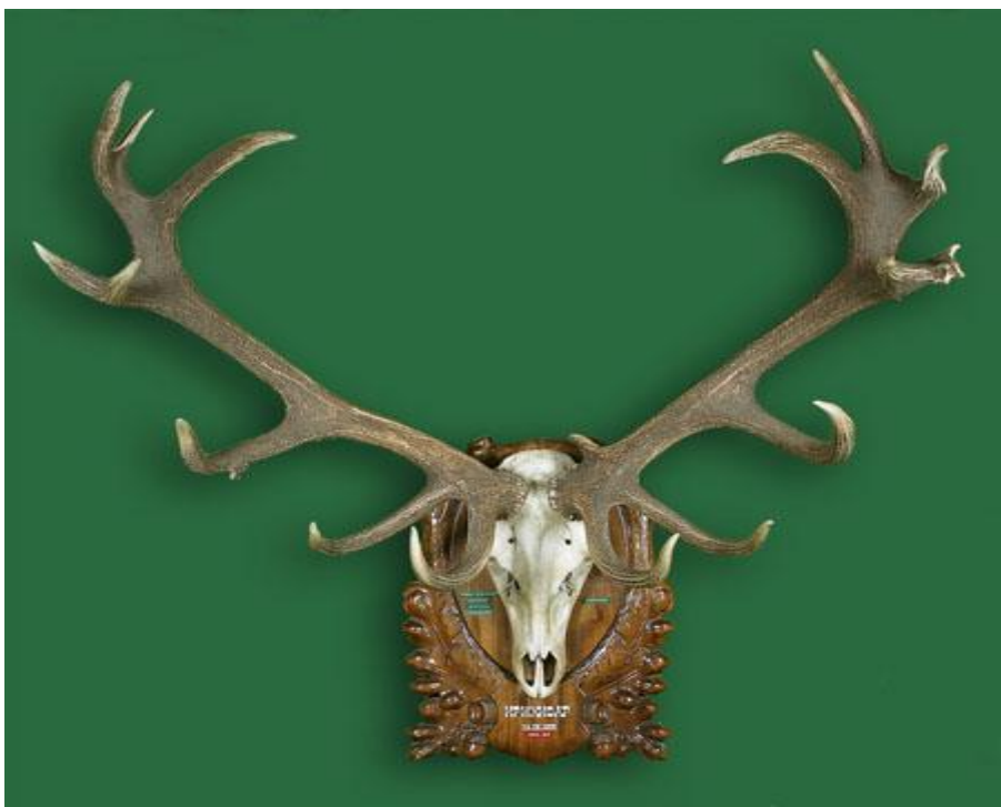
Трофей от благороден елен - Световен рекорд - Отстрелян в Ири Хисар – 1978 г.

253,62 точки СІС /Чешке Будейовице – 1976 г./