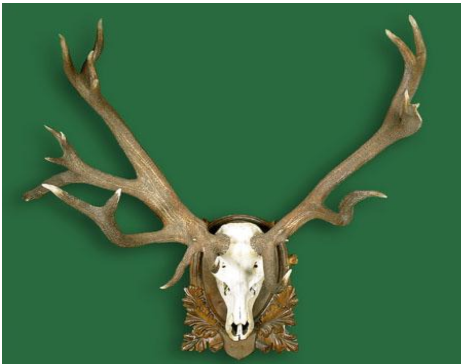
Трофей от благороден елен - Световен рекорд - Отстрелян в Ири Хисар – 1975 г.

253,62 точки СІС /Чешке Будейовице – 1976 г./